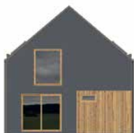
môj dom špecial 2022